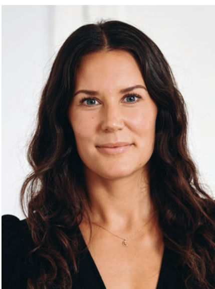
MATHILDA BY Administration